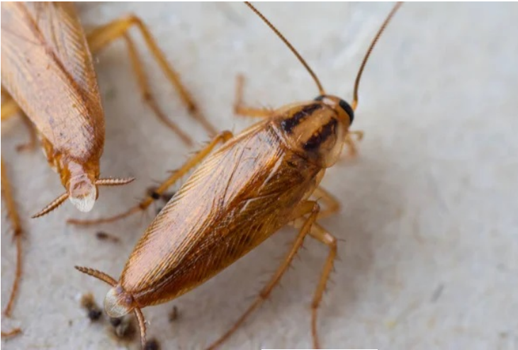
Las cucarachas pueden transmitir la salmonelosis

Estos insectos se benefician de los dos factores claves del verano, la humedad y el calor. Se desenvuelven en las cañerías todo el año, debido a que preservan un vapor tibio y húmedo. En el verano, aprovechan para reproducirse, además de salir a los desagües. De ahí a los lavabos de la cocina o el baño para buscar alimentos, libres del frío.