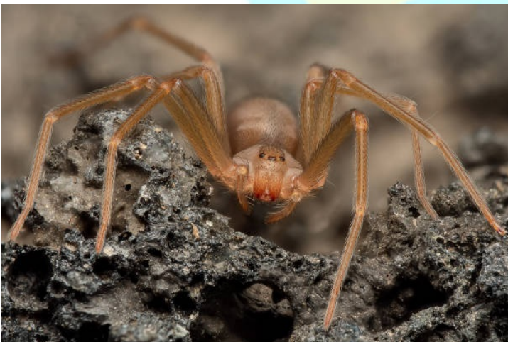
La mordida de la araña violinista es de la más peligrosa para el ser humanos

Viven normalmente en patios y jardines. Con las lluvias, buscan refugio en el interior de los hogares o almacenes. Particularmente en grietas donde el agua no llega. En México y otros países, es de especial cuidado la araña violinista, que tiene un veneno poderoso, sin ser todavía reconocida como la viuda negra.